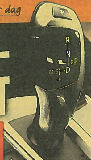
● SIDE 24, 25 og 26

26 POPULÆRE BILMODELLER – SÅ MYE MER KOSTER AUTOMAT